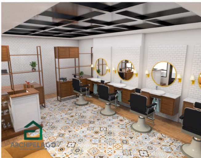
Barbershop East Jakarta